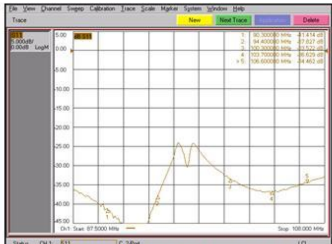
PERDIDAS DE RETORNO BA / RETURN LOSS WB