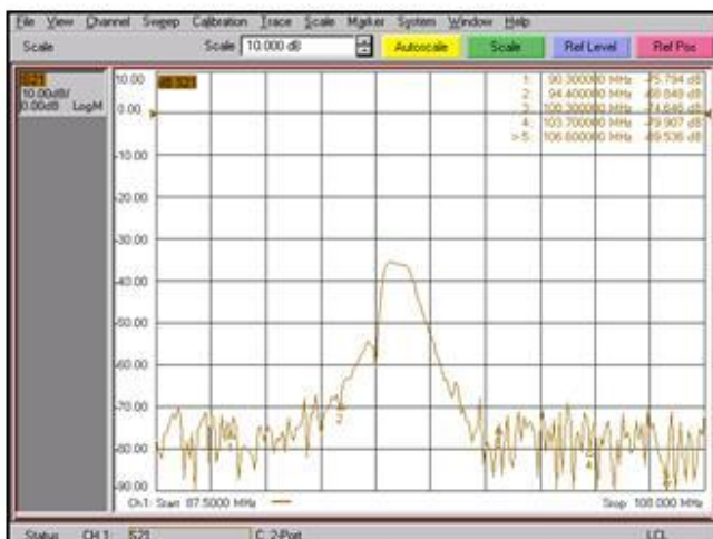
AISLAMIENTO BA - BE / ISOLATION WB - NB