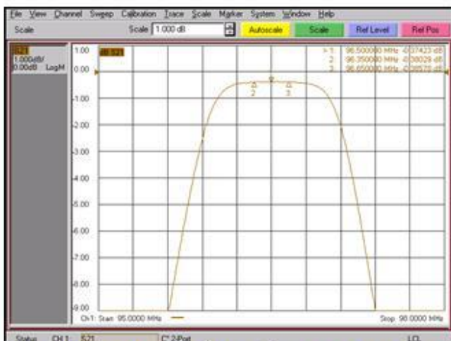
PÉRDIDAS DE INSERCIÓN BE / INSERTION LOSS NB