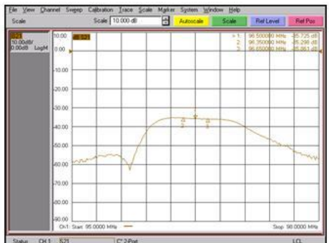
AISLAMIENTO BE - BA / ISOLATION NB - WB