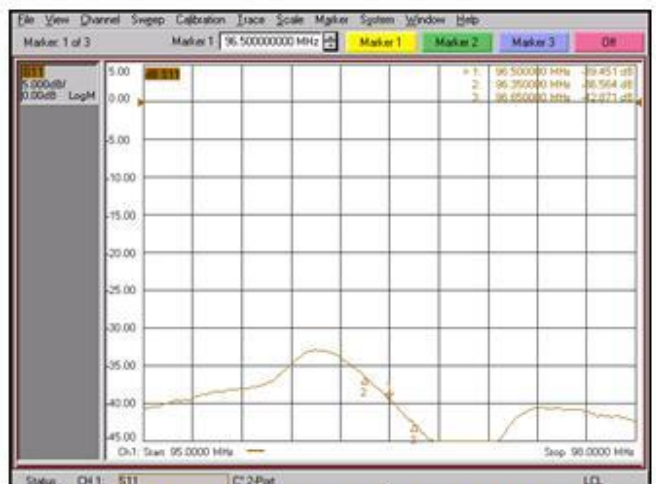
PÉRDIDAS DE RETORNO BE / RETURN LOSS NB